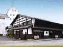
創業元治元年(1864年)、花の舞創業者 高田 市三郎が遠江国あらたま村宮口で清酒製造業を始める。商品名の「花の舞」の銘柄は、天竜川系に古来から伝わる黍納おどり「花の舞」に由来します。

花の舞酒造株式会社 〒434-0004 静岡県浜松市浜北区宮口632 電話 053-5822121(代)