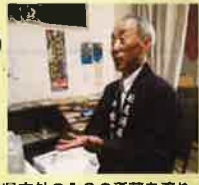
県内外の13の酒蔵を廻り歩き、「能古見」「松浦一」「万里長」そして「宮の松」県を代表する数々の酒を手掛け、全国に通用する銘柄を世に出した。

合名会社 松尾酒造場 〒849-4154 佐賀県杵臼郡有田町大木宿乙六一七 電話 0955-462411(代)