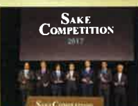
日本酒の品評会「SAKE COMPETITION」で国内外の453蔵が参加し、「土佐しらぎく純米吟醸 山田錦」が1位に入賞。過去最高の1730点が出品。