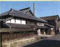
江戸末期に7代松尾長介の創業以来、150年余りに渡り、名水と自然に恵まれた有田郷の地で酒造りに取り組んでいます。