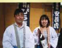
明治36年創業。代表銘柄は「土佐しらぎく」は初代仙頭菊太郎の「菊」と、白菊のように清らかで綺麗なお酒を醸したいという思いから命名。

有限会社 仙頭酒造場 〒781-5701 高知県安芸郡芸西村和食甲一五五番地 電話 0887-332611(代)