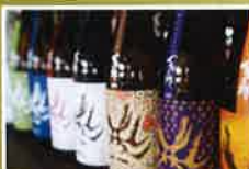
地元の歌舞伎役者「百十郎」の顔をモチーフにした、一度見たら忘れないインパクトのあるラベル