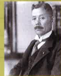
清酒李白の命名は、大正から昭和にかけて二度も内閣総理大臣を経験した、島根県松江出身の若槻礼次郎氏によって酒仙李白に因って命名された由緒ある酒名です。

李白酒造有限公司 〒690-0881 島根県松江市石橋町三三五番地 電話 0852-265555(代)