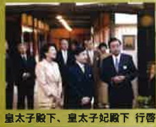
皇太子殿下、皇太子妃殿下 行啓

株式会社 小嶋総本店 〒9920037 山形県米沢市本町二丁目二三東町上通り 電話 0238-234848(代)